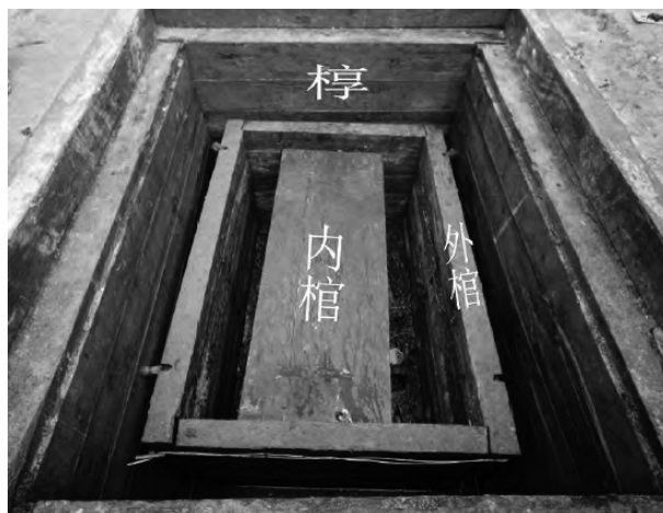
圖 1：沂源東里臺地 M1 槨棺圖 33