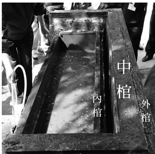
圖 2：安徽六安白鷺洲戰國 M585 34